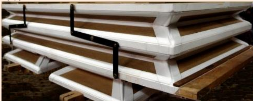
een geheel gerestaureerde balg

Onder in de orgelkas is een grote dubbele vouwbalg ingebouwd met twee schepbalgen. Deze grote balg zit achter de panelen van de orgelkast en de handhefboom (zie bovenstaande foto's) waarmee het orgel in 1890 werd "gepompt". Onder deze magazijnbalg zitten nog steeds de twee schepbalgen die de lucht in de magazijnbalg pompen! Sinds de aansluiting van een elektrische ventilator is de handboom, die verbonden is met de scheppen, vastgezet (het systeem is dus buiten gebruik!). Het schapenleer is origineel. De lederen hoekverbindingen zijn inmiddels gedeeltelijk gerepareerd. Omdat de grote dubbele vouwbalg geheel onderin het orgel zit adviseren wij om deze na de demontage van het orgel te restaureren zodat deze weer als nieuw is. Uit kostenbesparing kan men indien gewenst besluiten om de twee schepbalgen niet te restaureren, de handpompinstallatie kan dan echter nooit meer gebruikt worden.