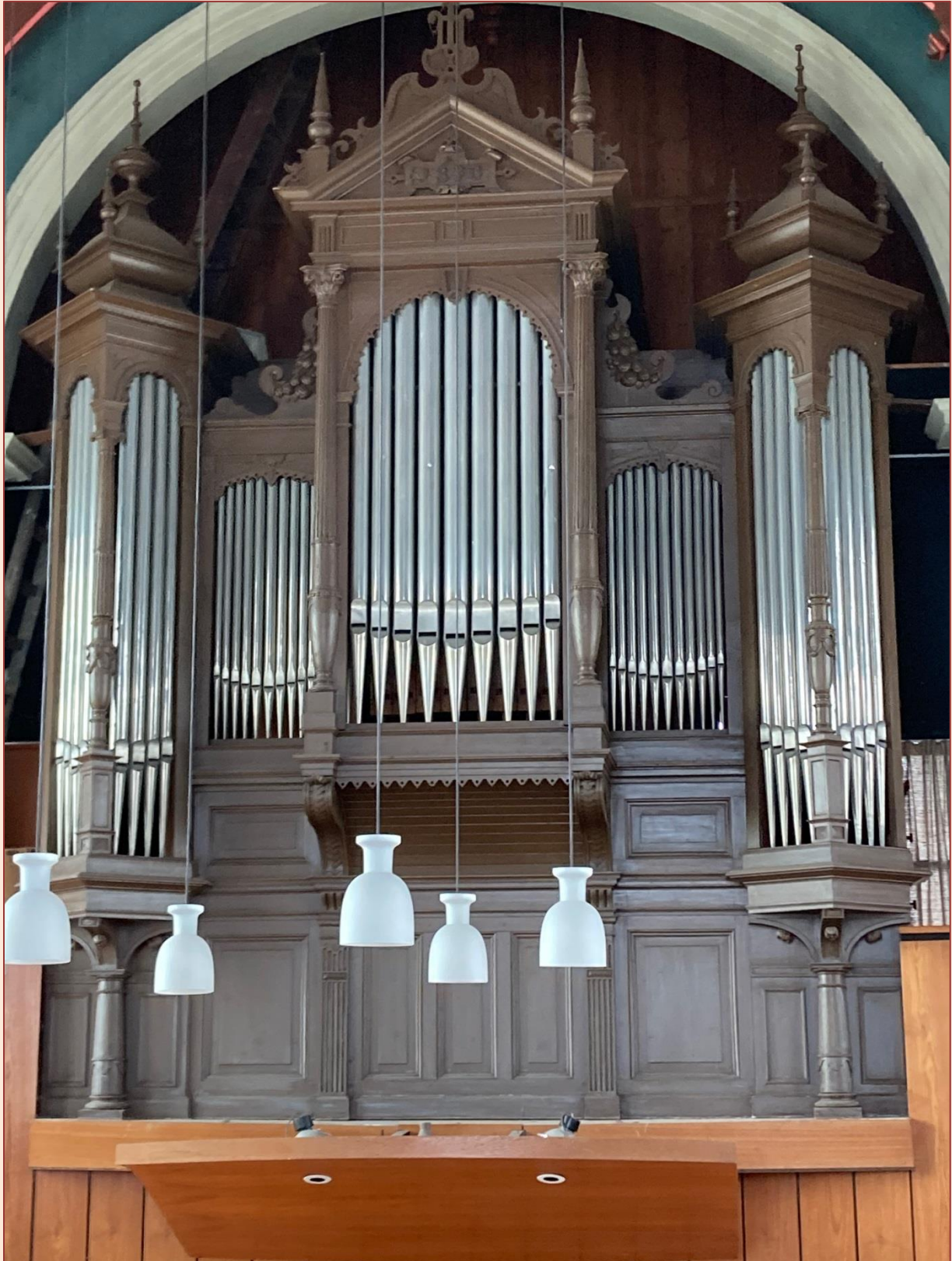
Bakker & Timmenga Gereformeerde kerk / reformierte Kirche / reformed church, Heeg (NL)

EEN ZEER KARAKTERISTIEK KERKORGEL EINE SEHR CHARAKTERISTISCHE KIRCHENORGEL A VERY CHARACTERISTIC CHURCH ORGAN