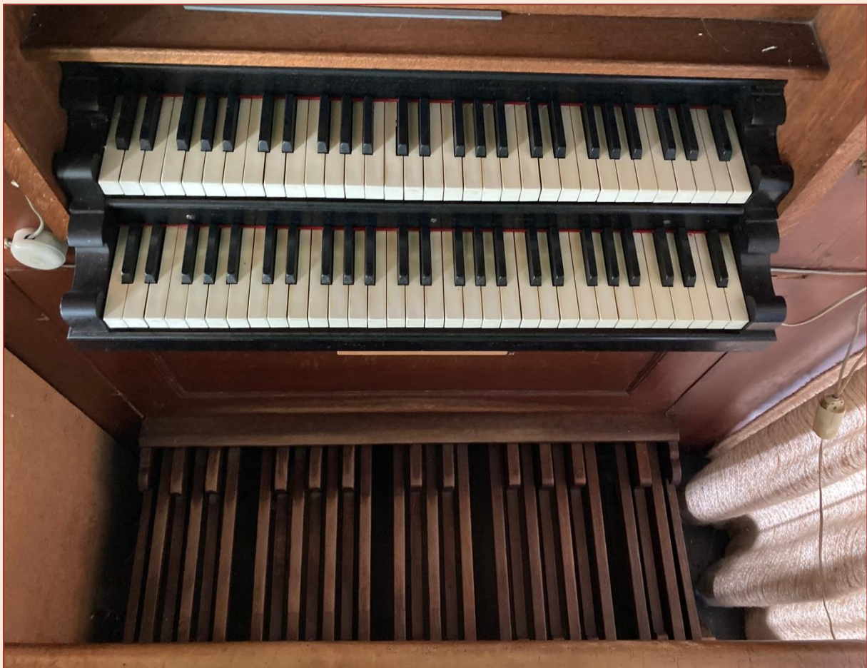
II/P, 17 st (1 transmissie)