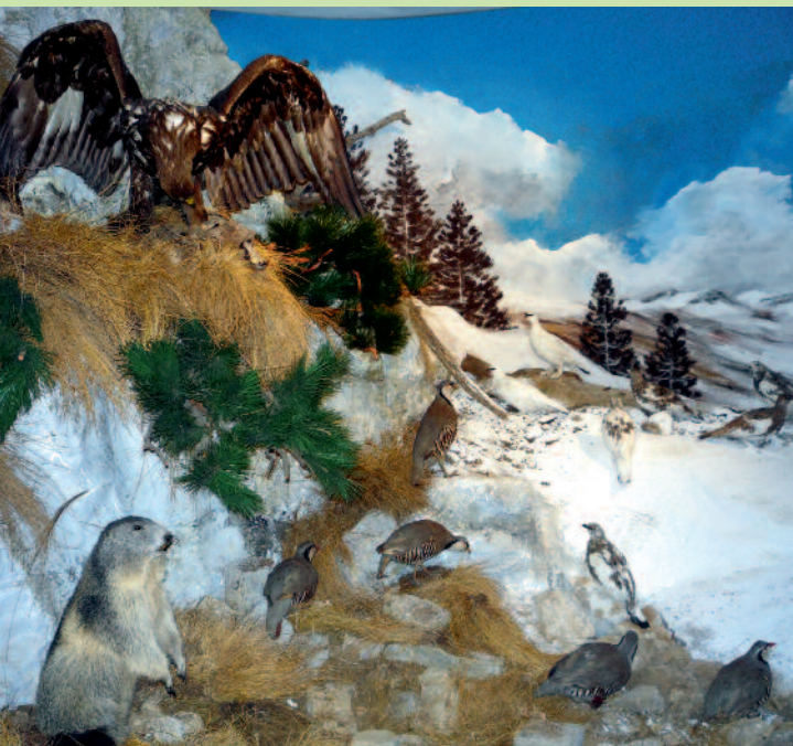
Sala Fauna degli altipiani - Saal Wildtiere der Hochebene