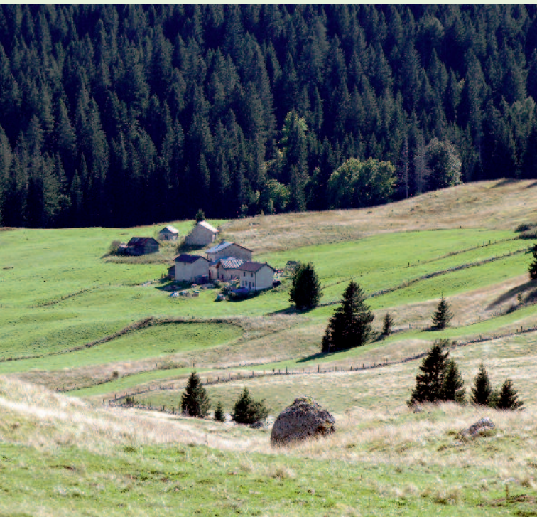
2. Località Bisele - Luserna/Lusérn