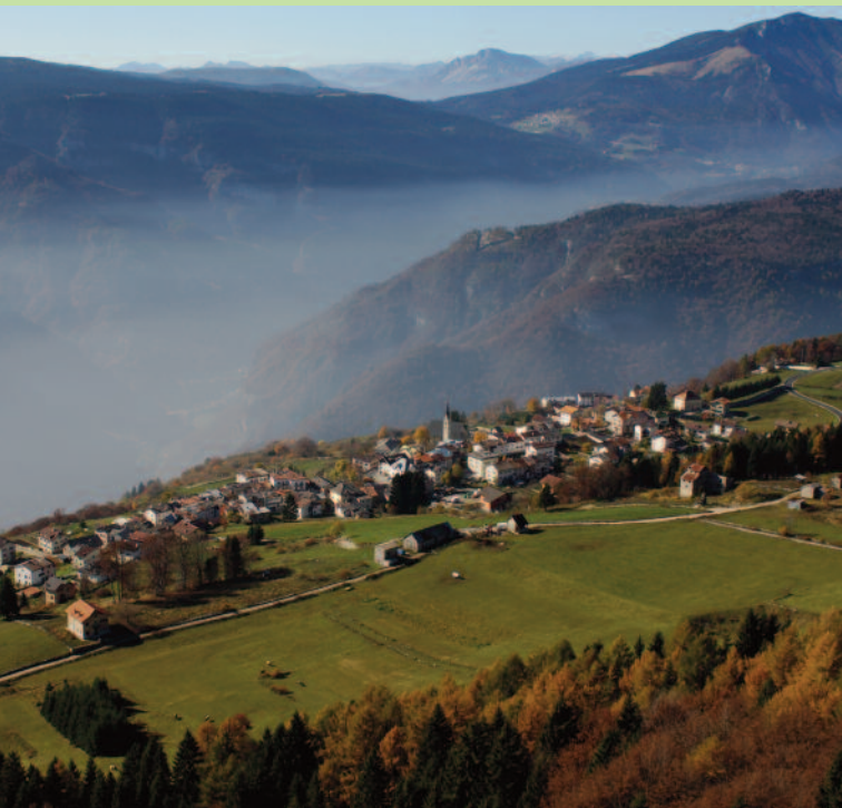
1. Foto aerea Luserna/Lusérn