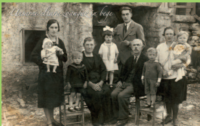
“Unsere Alten zeigen uns den Weg - I nostri anziani ci indicano la via”