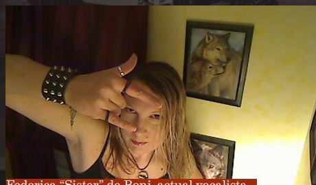
Federica "Sister" de Boni, actual vocalista

Es una lástima que al día de hoy WHITE SKULL no sea tan popular y pase desapercibido porque sus álbumes en general son de gran calidad, y este no es la excepción.