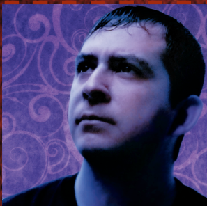
Autor - Lestat 546

Hace varios días llevo en mente crear un nuevo proyecto, debido en buena parte, a las constantes reseñas que se publican en el blog de http://tarrazu.wordpress.com/