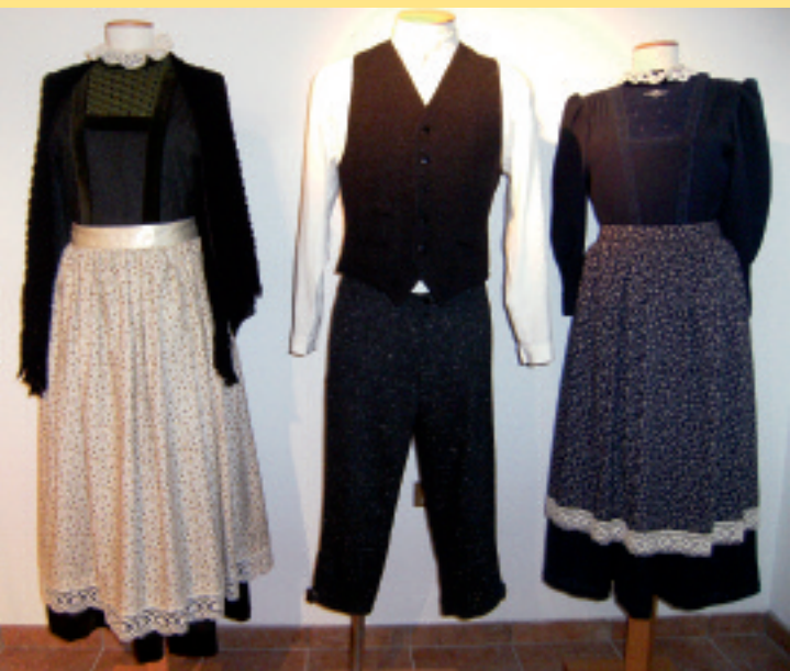
Abiti e costumi del passato di Luserna Kleider und Trachten der Vergangenheit von Lusérn

comunanze nel modo di vestire nelle epoche trascorse, ma anche le peculiarità dell'abbigliamento nelle diverse valli dolomitiche e alpine.