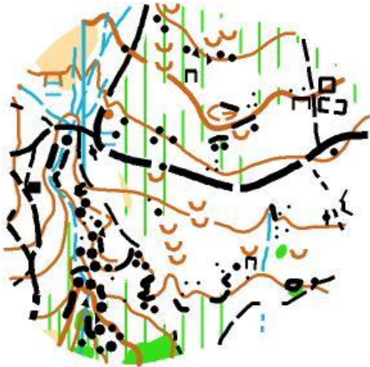
Mapa carrera Larga

En el mapa urbano habrá marcadas varias calles en las que el tráfico puede ser más intenso y debemos extremar las precauciones el resto como siempre los vehículos circulan con normalidad y seremos nosotros los que debemos ir anticipando para evitar sorpresas.