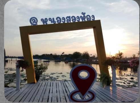
รูปภาพ : อนุสรณ์หนองสองห้อง

เมื่อเห็นพลังประชาชนจำนวนมากที่มารอรับ ฯพณฯ จอมพลสฤษดิ์ ธนะรัชต์ จึงหยุดพักเยี่ยมประชาชน ซึ่งผู้นำ ได้เสนอขอให้ท่านตั้งกิ่งอำเภอหนองสองห้องขึ้น เพราะมีระยะทางห่างไกลอำเภอพล การเดินทางไปติดต่อลำบาก ไม่สะดวก และมีพื้นที่เพียงพอกับการตั้งส่วนราชการหน่วยงานต่างได้ ต่อจากนั้นมา 7 เดือน คือเดือนธันวาคม 2504 หลังจาก ฯพณฯ จอมพลสฤษดิ์ ธนะรัชต์ เดินทางกลับกรุงเทพฯ ได้มี ประกาศกระทรวงมหาดไทย ยกฐานะหนองสองห้องขึ้น เป็น กิ่งอำเภอหนองสองห้อง เมื่อวันที่ 1 มกราคม 2505 ตามประกาศกระทรวงมหาดไทย ลงวันที่ 27 ธันวาคม 2504 ให้ขึ้นตรงต่ออำเภอพล จังหวัดขอนแก่น ต่อมาเพียงปีเศษ กระทรวงมหาดไทยได้ประกาศยกฐานะขึ้นเป็น อำเภอหนองสองห้อง เมื่อวันที่ 16 กรกฎาคม 2506