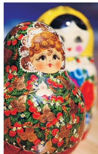
Русский сувенир: матрёшки

* Um ganz sicher zu gehen, können Sie die Karte auf der Umschlagseite zu Hilfe nehmen.