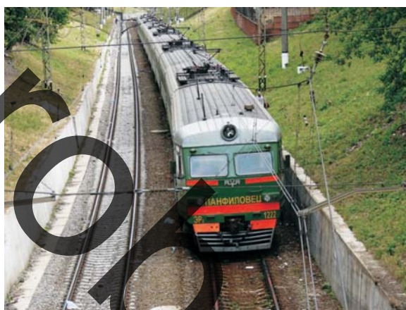
На поезде по России