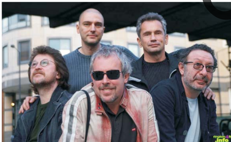
Группа «Машина времени»