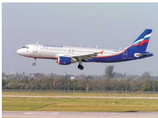
Самолёт компании «Аэрофлот»

В настоящее время ОАО «Аэрофлот-Российские авиакомпании» является ведущей авиакомпанией не только в России, но и на международном уровне, эксплуатирует российские и зарубежные самолеты: ИЛ-96-300, ИЛ-62, ИЛ-86, ТУ-154, Боинг-757, 767, 777 и другие. Появились новые конкурентные авиакомпании: «Сибирь», «Трансаэро» и другие.