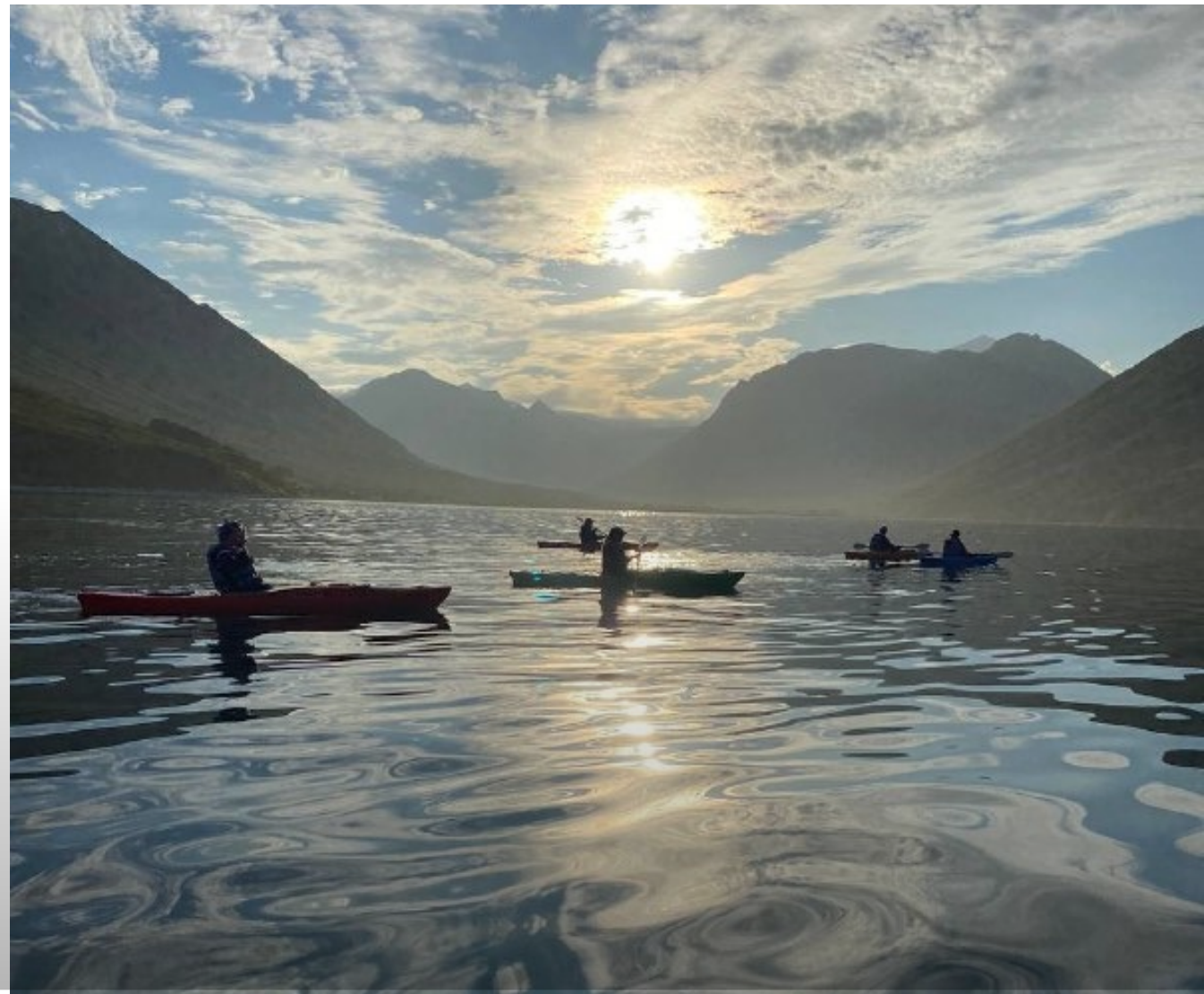
БУХТА РУССКАЯ КАРЯКИНГ