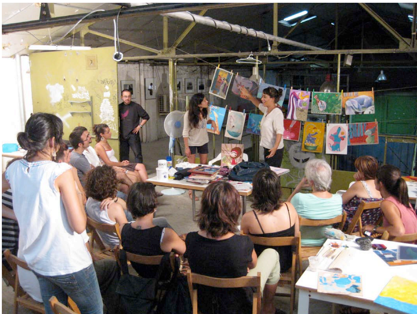
Intensivo junio de 2009 en La Nau Ivanow