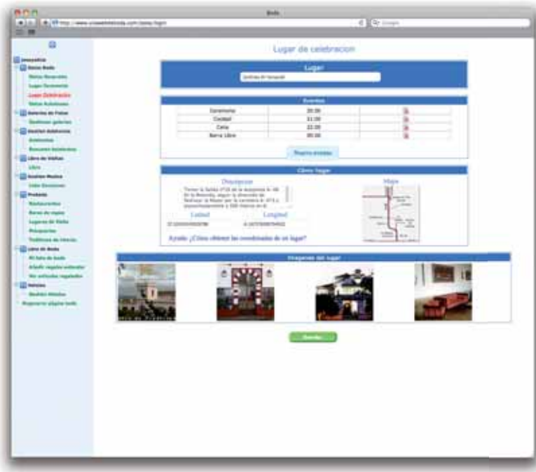
Pantalla de gestión de datos de la boda reservado a los novios.

Desde la intranet de unawebde boda.com podréis gestionar, modificar, eliminar y añadir todo el contenido que está presente en vuestra web de boda.