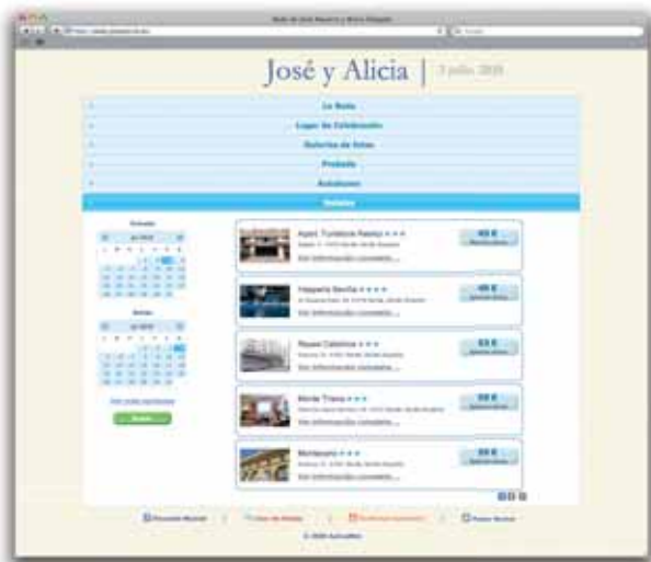
Selección de hoteles para las reservas.

necesitan se encuentre disponible en un sólo formato, accesible desde cualquier lugar y actualizable según cambien vuestras necesidades.