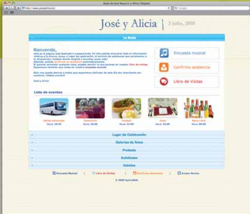
Ventana principal de la web de la celebración, con todas las utilidades.