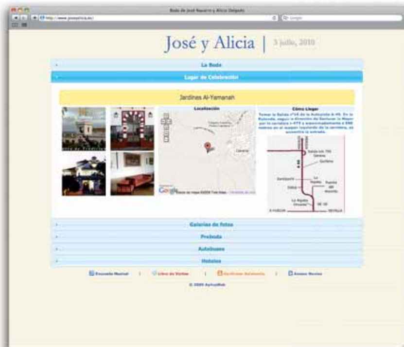
Vista general de la utilidad, que incluye fotos, mapa de localización y accesos.

Esta sección de vuestra web, de un modo muy visual y directo, es la que va a permitir a los invitados conocer perfectamente la secuencia de los acontecimientos. Desde la hora y el sitio en el que están citados para asistir a la ceremonia de vuestro enlace, hasta el lugar en el que lo celebraréis. Podréis dar todo el lujo de detalles que queráis.