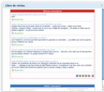
Pantalla del libro de visitas para hacer comentarios, una utilidad divertida y efectiva.

Haréis partícipes a todos de vuestra boda, meses antes de que llegue el gran día. Y por supuesto, podréis filtrar en tiempo real todos los mensajes. Comunicación completa, control total.