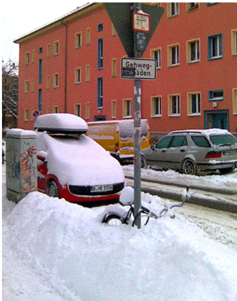
Abb. 2: Sorgen Sie dafür, dass Ihre Dokumentation von allen gefunden werden kann.

Sämtliche Mitarbeiter erwarten von der Geschäftsführung, dass das Unternehmen Gewinne erwirtschaftet. Und das tun die meisten Softwareunternehmen. Wenn wir also mehr Engagement des Unternehmens in die Dokumentation einfordern, kann die Fragestellung nur lauten: Wieso sollten trotz Unternehmensgewinn Ausgaben in die Technische Dokumentation fließen? Es wird sehr schwer werden, dies mit Zahlen zu untermauern.