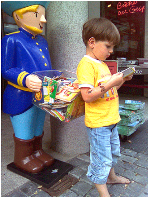
Abb. 4: Helfen Sie der Community, es sich bequem zu machen.

Setzen Sie sich für ein Forum ein. Es geht dabei hauptsächlich um die soziale, öffentliche Kommunikation der Nutzer untereinander mit Ihnen als von allen akzeptierten Moderator. Anwender fragen immer erst andere Menschen nach deren Erfahrung. Ob im Büro oder im sozialen Netzwerk. Die Dokumentation ist immer die letzte Zuflucht.