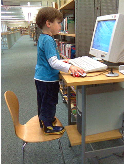
Abb. 3: Machen Sie es Experten einfach, Ihr Wissen zu verschriftlichen.

Setzen Sie sich dafür ein, dass sämtliche Subject Matter Experts ihr Wissen unkompliziert in die Dokumentation mit einfließen lassen können. Das sind sowohl Supporter, Softwareentwickler und Software-Anwender. Ein Beispiel und Ausblick auf diesen Trend gibt Mike Hughes - The Degentrification of User Assistance .