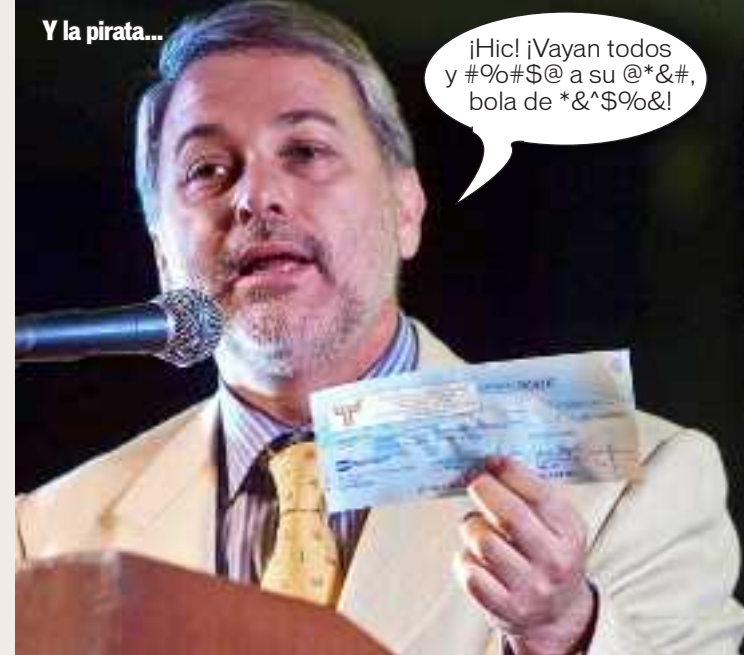
Y la pirata...

¡Hic! ¡Vayan todos y #%#$@ a su @*#&#, bola de *&#$%&!