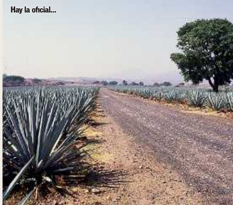
Hay la oficial...