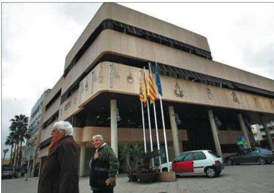
Fachada principal del Ayuntamiento de Santa Pola.

trasladados a la Fiscalía Anticorrupción de Alicante, según informa el periódico digital Elche-digital.es