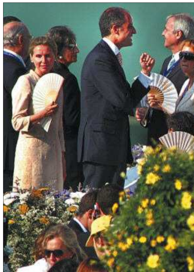
Arriba, Mariano Rajoy y Francisco Camps, entre otros cargos públicos e invitados, durante la visita del Papa a Valencia en julio de 2006. Abajo, urinarios instalados en las calles de Valencia para el acontecimiento

Dado que Orange Market obtenía contratos de las administraciones públicas y trabajaba en la orga-