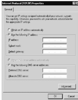
Fig. 4 - Internet Protocol (TCP/IP) Properties

Sometimes it may be necessary to restore the Factory Default settings. To restore the Factory Default: 1-Disconnected the power supply (Mains and battery); 2-Short-circuit terminals [PGM1] , [IN1] and repower the B-NET not less than 30 sec.