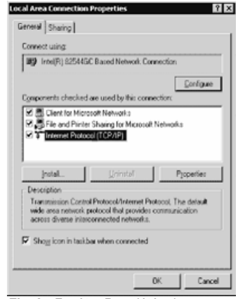
Fig. 3 - Fenêtre Propriétés de Connexion au Réseau Local.