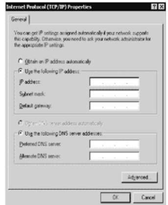
Fig. 4 - Fenêtre Propriétés Protocole Internet (TCP/IP)

Dans certains cas il peut être utile de restaurer les Paramètres d'Usine. Suivre la procédure suivante : 1- ôter entièrement l'alimentation au B-NET (Secteur et piles) ; 2- en maintenant le pontage entre les terminaux [PGM1] et [IN1], alimenter la carte pendant au moins 30 secondes.