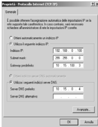
Fig. 4 - Finestra Proprietà Protocollo Internet (TCP/IP)

In alcune circostanze può essere utile ripristinare le Programmazioni di Fabbrica. Eseguire i passi successivi: 1-scollegare completamente l'alimentazione della B-NET (Rete e batterie); 2-Tenendo cortocircuitati i morsetti [PGM1] e [IN1] alimentare la scheda per almeno 30 sec.