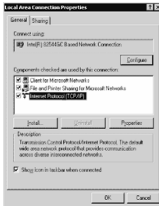
Fig. 3 - Local Area Connection