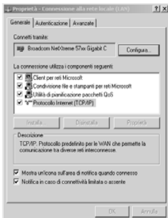
Fig. 3 - Finestra Proprietà di Rete.