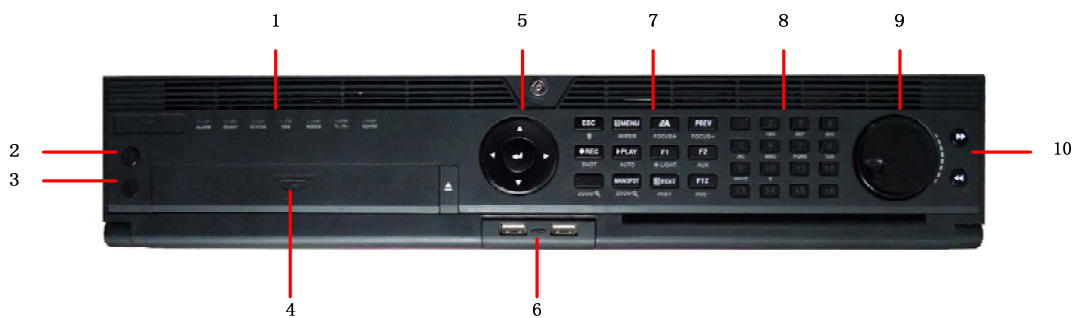
Frontal del DS-9000-SE y DS-9100-SE