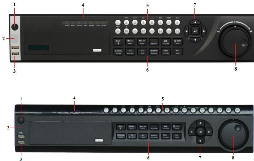
Frontales del DS-9000-S y DS-9100-S